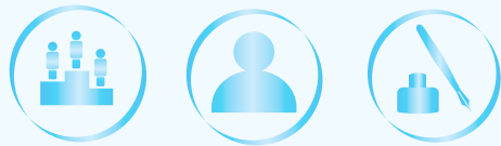
Iconos de acceso directo fácilmente reconocibles